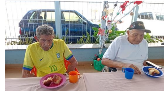
Atividades de vida diária idosos Centro Dia de segunda a sexta feira.