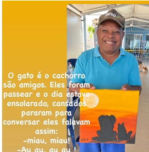
O gato é o cachorro são amigos. Eles foram passear e o dia estava ensolarado, cansados pararam para conversar eles falavam assim: -miau, miau! -Au au, au au ! José Rosa (68 anos)