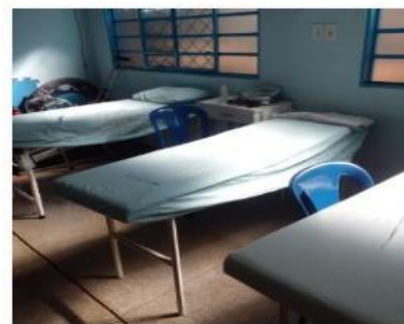
CAMAS PARA FISIOTERAPIA