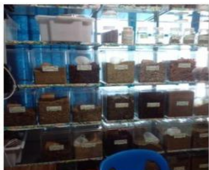
PLANTAS PARA CHÁS