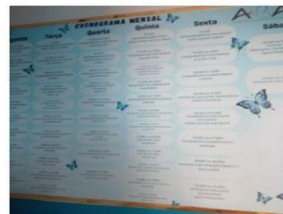
LISTA DE ATIVIDADES

Rio Verde – GO, datado e assinado digitalmente.