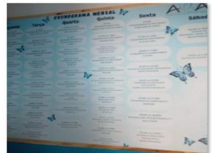
LISTA DE ATIVIDADES

Rio Verde – GO, datado e assinado digitalmente.