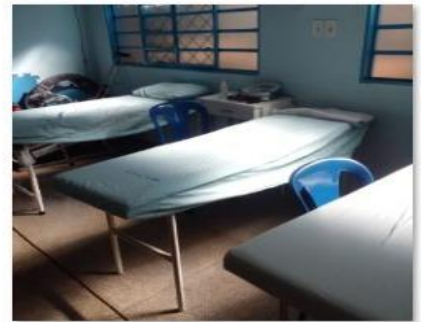
CAMAS PARA FISIOTERAPIA