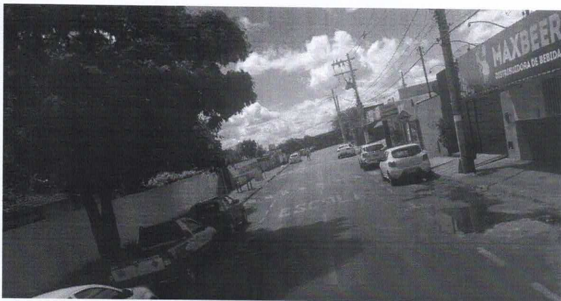
Imagem de vista terrestre antes da instalação