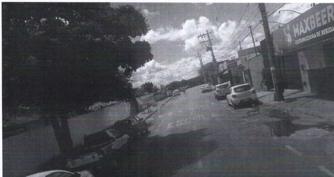
Imagem de vista terrestre antes da instalação