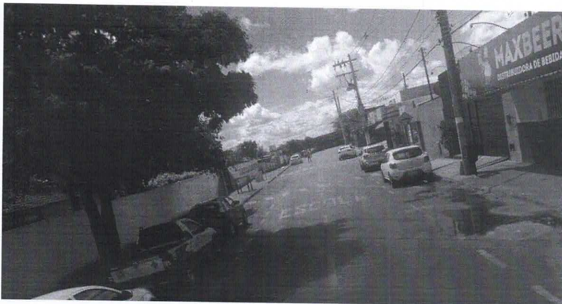
Imagem de vista terrestre antes da instalação