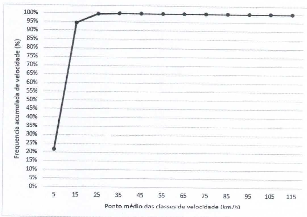
Gráfico – Frequência acumulada de velocidade (%) x ponto médio das classes de velocidade (km/h)