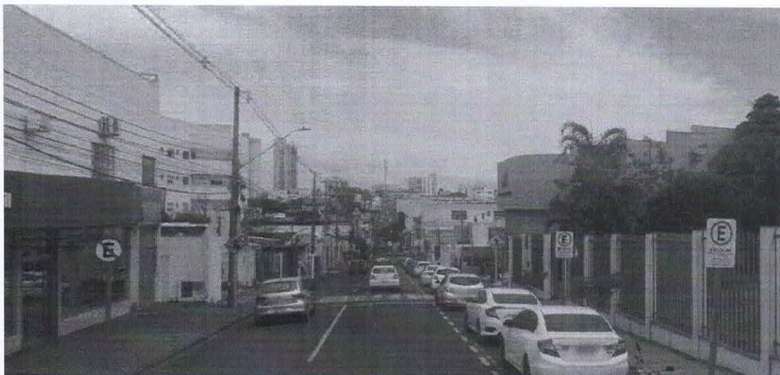
Imagem de vista terrestre antes da instalação