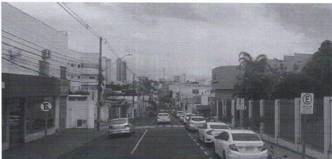
Imagem de vista terrestre antes da instalação