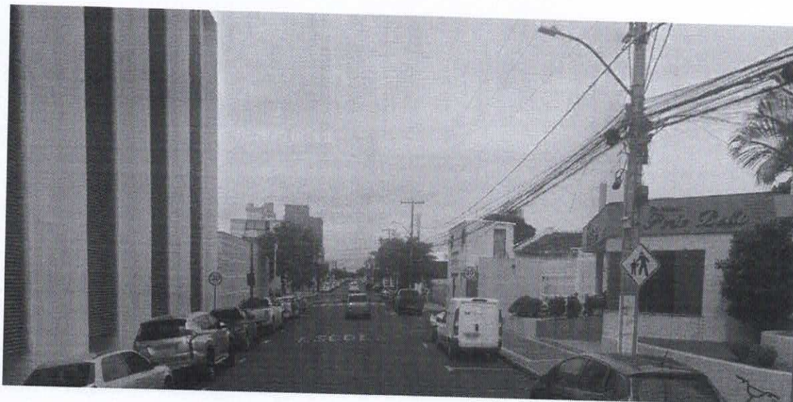
Imagem de vista terrestre antes da instalação