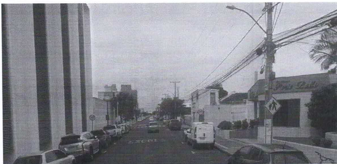
Imagem de vista terrestre antes da instalação