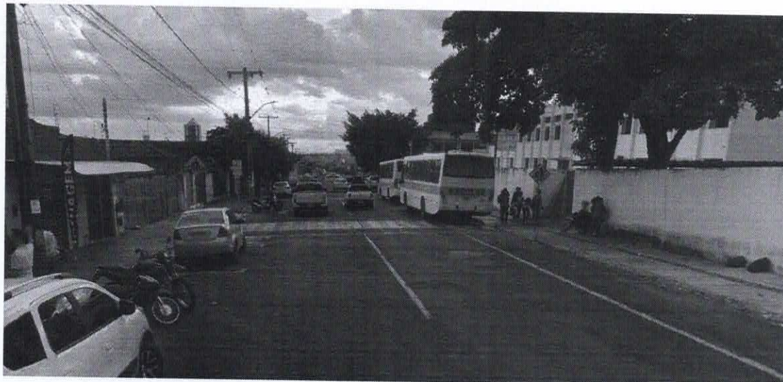
Imagem de vista terrestre antes da instalação