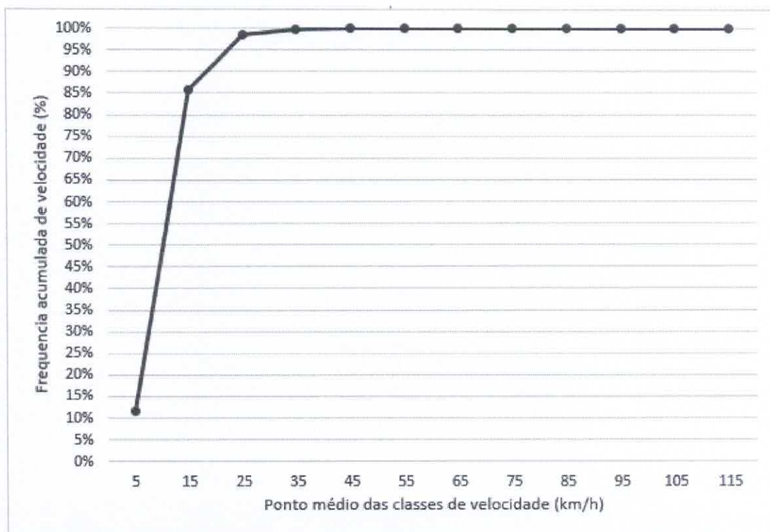
Gráfico – Frequência acumulada de velocidade (%) x ponto médio das classes de velocidade (km/h)