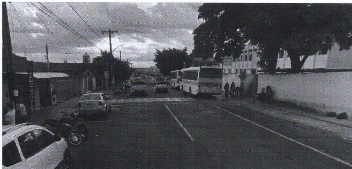
Imagem de vista terrestre antes da instalação