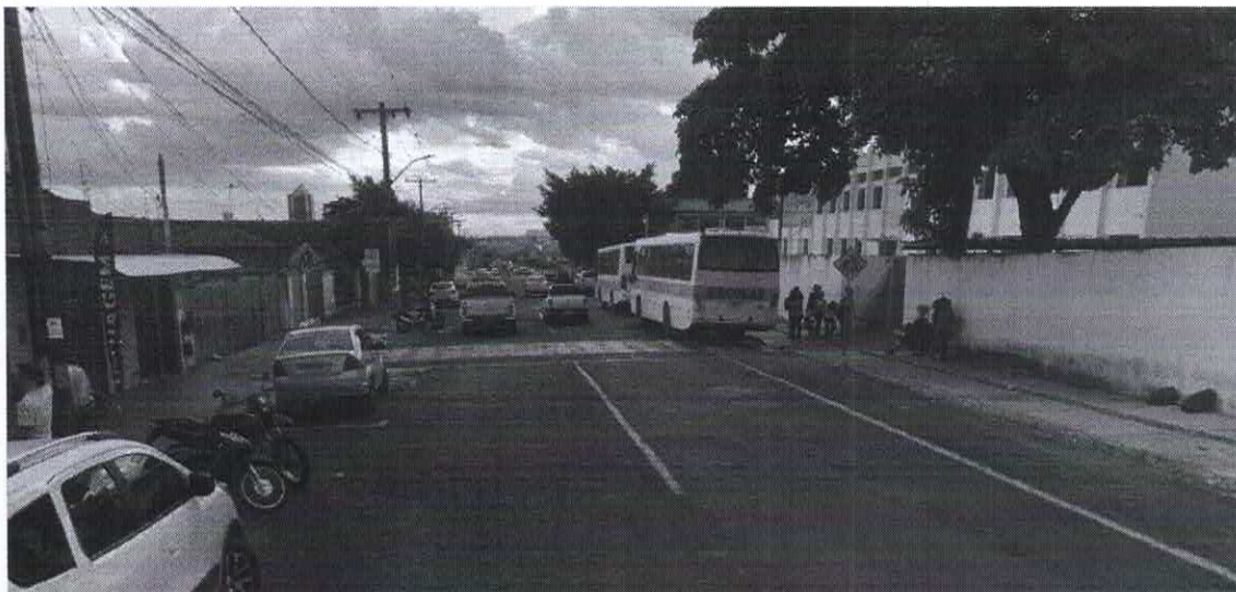
Imagem de vista terrestre antes da instalação