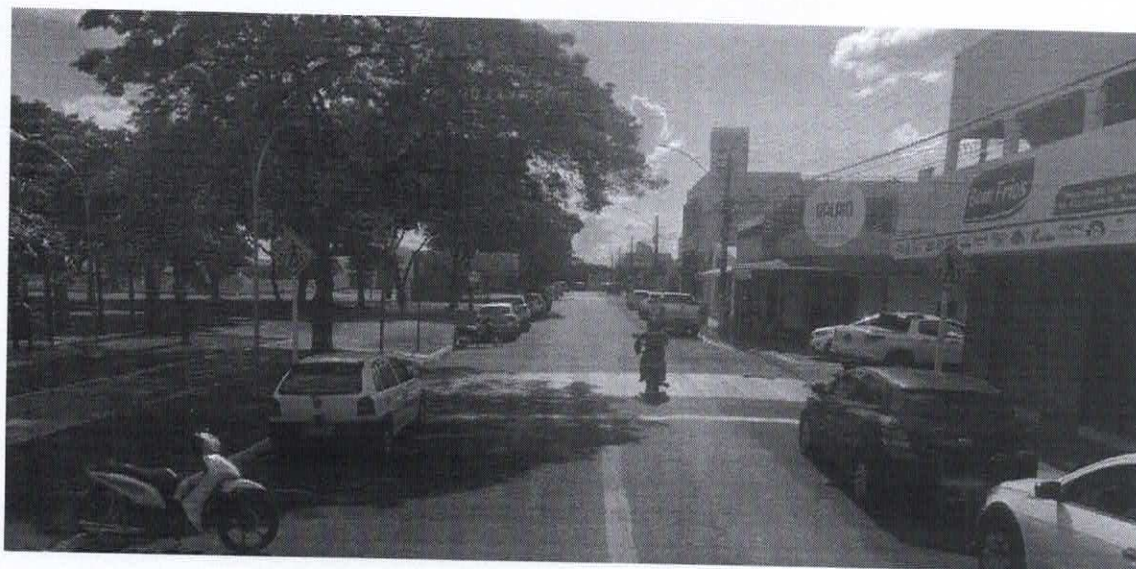
Imagem de vista terrestre antes da instalação