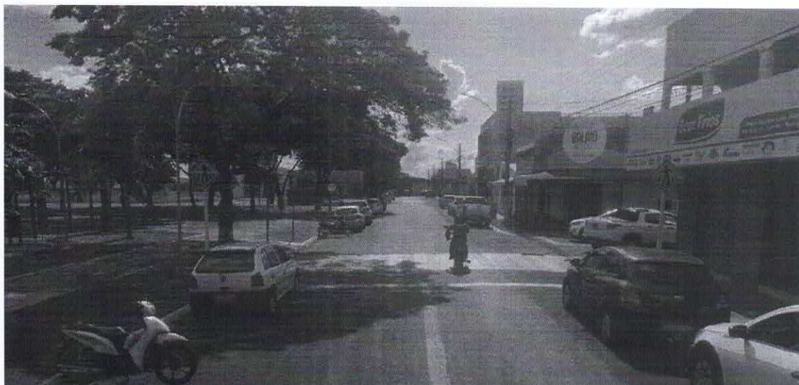
Imagem de vista terrestre antes da instalação