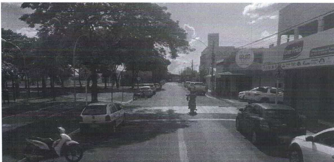
Imagem de vista terrestre antes da instalação