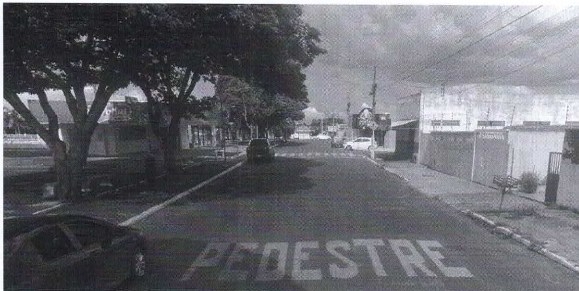
Imagem de vista terrestre antes da instalação