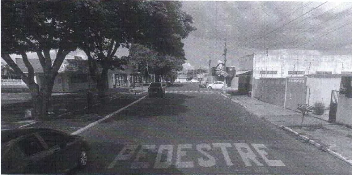
Imagem de vista terrestre antes da instalação